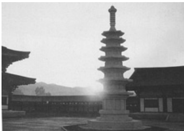
▲ 정릉사 7층탑(평양 동명왕릉 앞)

북한의 역사서에는 신라의 통일이라는 표현은 존재하지 않으며, 신라의 통일과정은 단지 신라와 당나라의 연합 침공에 대한 고구려와 백제인의 투쟁으로 묘사되고 있다. 따라서 북한 역사서에서 ‘통일신라’는 ‘후기신라’로 표현되어 있으며 삼국통일기의 역사는 고구려를 계승한 발해를 중심으로 서술되고 있다.