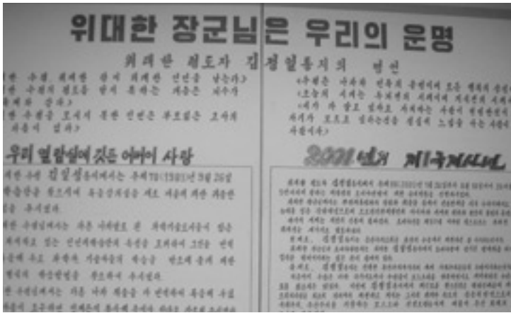
▲ 인민대학습당 내부에 게시된 글

생산관계의 교체과정으로 보거나 혁명투쟁을 계급들의 경제적 이해관계의 대립에 의한 충돌로만 이해하지는 않았다.