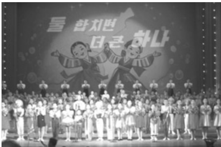
▲ 만경대 소년학생 공전

남북한의 이질화된 역사인식은 문화의 이질화, 가치관의 이질화를 심화시켜 왔다. 남북한 역사인식의 차이를 확인하고 이를 극복하여 하나의 역사를 창출하는 과업은 민족동질성 회복과 민족통합의 긴 여정에서 반드시 이루어내야 할 과제이다.