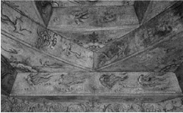
▲ 강서대무덤 벽화

그 성격에서 큰 차이를 드러내고 있다. 남한의 민족주의사관이 그 문호가 넓어지고 다양한 세계와 공존할 수 있는 방향으로 발전해 온 데 비해 북한의 민족주의사관은 폐쇄적인 발전을 거듭하며 세계사와 고립되어 왔던 것이다.