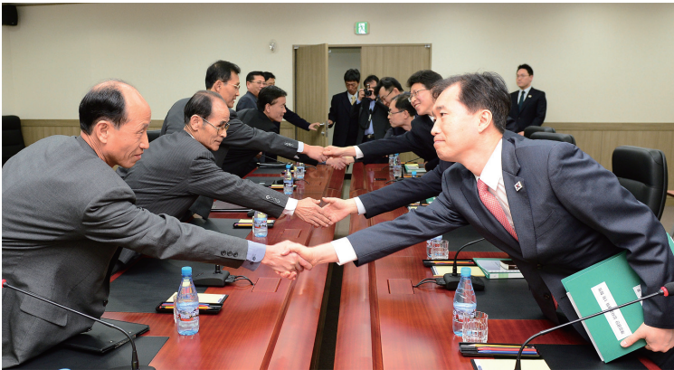
〈개성공단 상사중재위원회 운영을 위한 제1차 회의('14.3.13.)〉

남북은 구체적인 합의에는 이르지 못했지만, 상사중재제도의 의미와 필요성에 공감하였다. 서로 이견을 가진 사안에 대해서는 협의를 계속해 나가기로 하였으나, 이후 북측이 호응하지 않아 후속협의를 진행하지 못했다.