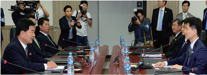
〈개성공단 남북공동위원회 제6차 회의('15.7.16.)〉

우리측은 산적한 공단 현안문제 논의를 위한 후속 협의를 제안하였으나, 북측이 자기들의 요구를 수용하지 않으면 의미가 없다고 주장하여 후속 일정에 합의하지 못하였다.