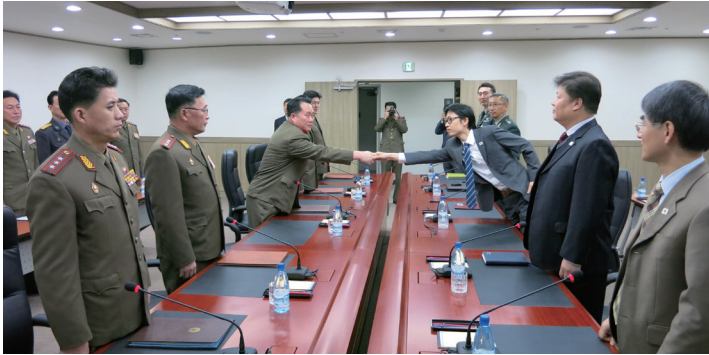
〈개성공단 통행·통신·통관 분과위원회 제4차 회의('14.1.24.)〉

통행·통신·통관 분과위원회 제4차 회의의 후속 조치로 2월 7일 통신분야 실무협회가 개최되어 인터넷 연결과 관련된 주요 쟁점(인터넷 망 구성·경로, 인증방식 등)의 합의가 이루어졌다. 일일 단위 상시통행의 경우 기술점검을 거쳐 1월 28일부터 시범적으로 실시되었으나, 5월 16일 북한의 일방적인 통신네트워크 차단으로 중단되었다.