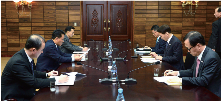
〈남북당국회담을 위한 실무접촉('15.11.26.)〉

우리 언론은 “남북대화 복원의 첫발” 7 이라고 평가하면서, 남북당국회담을 내실 있게 준비하여 남북관계의 실질적 발전을 도모해야 할 것이라고 보도하였다. 8