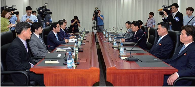
〈개성공단 남북공동위원회 제5차 회의(‘14.6.26.)〉

남북공동위원장 간 두 차례 접촉에서도 북측이 동일한 입장을 되풀이하여 제5차 회의는 합의 없이 종료되었다. 향후 남북공동위원회와 분과위원회 회의 개최 일정은 개성공단 남북공동위원회 사무처를 통해 조율하기로 하였다.