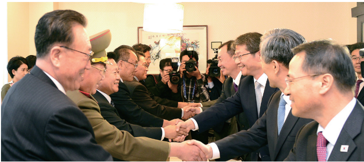
〈인천 아시아경기대회 폐회식 계기 남북고위급회담(‘14.10.4.)〉