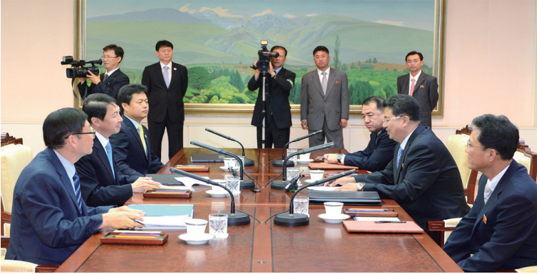
〈인천 아시아경기대회 남북실무접촉('14.7.17.)〉

한 문서협의를 제의하였고, 우리측은 이를 수용하였다. 남북한은 판문점 연락채널을 통해 북한 선수단의 대회 참가 문제를 협의하여, 북한 선수단 규모, 이동경로, 편의보장 등에 합의함으로써 북한 선수단의 인천 아시아경기대회 참가가 성사되었다.