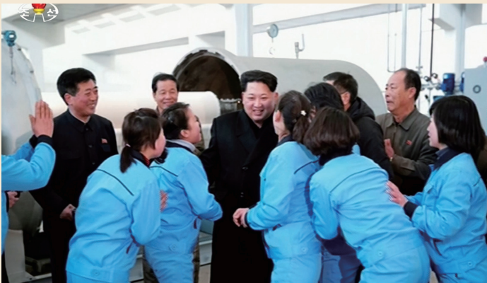
김정은이 김정숙평양방직공장을 방문해 여직원들과 스킨십을 나누는 모습(2016.1.28.)

김정은의 공포정치는 김정은의 유일영도체계를 확립해 나가는 과정에서 추진되고 있다. 이 과정에서 관료들에게 공포심과 함께 숙청과 처벌을 피하기 위해서는 수령에 대한 절대 충성을 해야 한다는 것을 보여주는 것이다. 다른 한편으로는 수령의 인민대중제일주의에 근거한 정책들이 종파 분자나 관료들의 세도나 관료주의, 부정부패로 왜곡되고 있다는 점을 부각시키면서 이에 대한 수령의 엄격한 처벌을 통해 인민대중들의 지지를 획득하려는 측면도 존재하는 것이다.