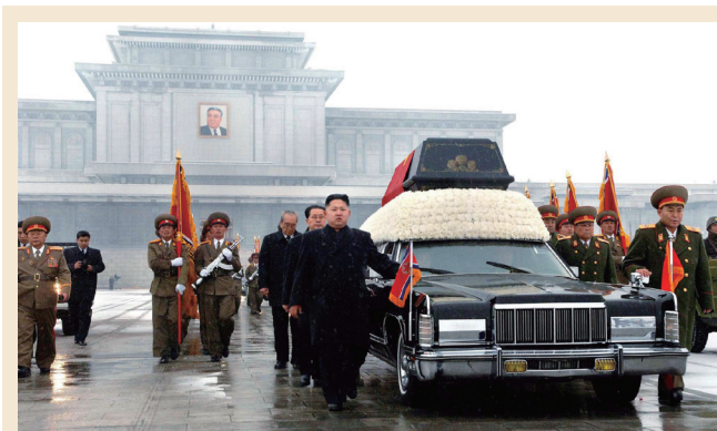
김정일 장례식 운구차를 호위하는 8인 모습(2011.12.29.)

이러한 엘리트 변동에 따라 백두혈통을 대표했던 장성택과 김경희를 대신하여 김정은의 여동생 김여정을 중심으로 형 김정철, 이복누이 김설송 등이 권력전면에 등장할 조짐을 보이고 있다. 그리고 장성택 숙청 이후 빨치산 계승 세력을 대표하는 최룡해에게 권력이 편중되는 것을 방지하기 위해 김정은을 후계자로 옹립했던 공신들을 대표하는 황병서의 역할이 커지고 있다. 이에 따라 새로운 연대세력이 형성되고 있다고 볼 수 있다. 이와 함께 김정은의 공포정치를 뒷받침하고 있는 국가안전보위부와 당 조직지도부 중심 세력들이 지속적으로 강한 영향력을 행사할 것으로 보인다. 한편, 간부선발기준에서 이념과 더불어 전문성을 중시하는 경향이 강해졌다. 내각은 박봉주 총리 임명과 더불어 대부분의 상들을 해당 부서에서 오랫동안 근무해 온 전문가 그룹으로 포진시켰다. 제7차 당대회에서도 이러한 경향이 강하게 반영되었다.