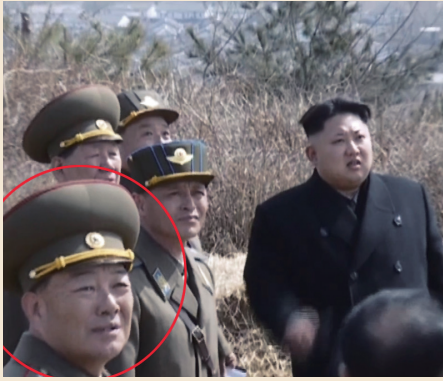
현영철 인민무력부장(왼쪽 원안)의 모습(2015.5.13.)