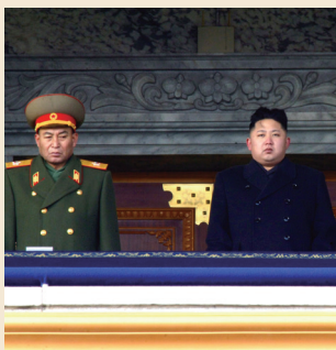
정치국 상무위원 겸 인민군 총참모장 리영호(왼쪽) 모습 (2012.7.16.)

최고결정권은 오직 수령에게만 있고 당조직, 국가기관, 인민군대 등은 수령의 활용기구다. 즉, 당·정·군 위에 수령이 위치하는 이른바 ‘수령의 유일적 영도체계’이다. 그런데 당시 북한은 형식상 김정은의 유일적 영도체계를 유지하고 있었지만 그 어떤 북한 전문가도 김정은의 권력과 권위가 유일적 영도체계를 감당할 만큼 성숙해 있다고 보지 않았다. 대체로 주요 국가정책을 김정은 혼자 최종 결정하기보다는 그를 후견·지지하는 세력과 또는 각 진영의 대표들과의 협의를 통해 집체적으로 결정하는 것으로 파악하고 있었다. 이런 가정이 사실이라면 당을 중심으로 한 친인척 세력 및 빨치산 계승 세력이 당·국가체제를 정상화하는 과정에서 군부의 영향력을 축소시키기 위해 리영호를 숙청하도록 김정은을 설득한 것으로 볼 수 있다.