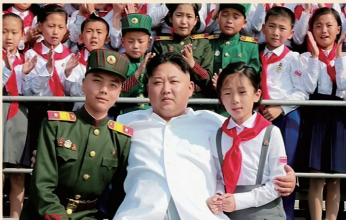
김정은이 만경대학생소년궁전에서 조선소년단 창립 70돌 행사 대표들과 기념사진을 촬영하는 모습(2016.6.7.)

이러한 주장은 제7차 당대회에서도 재강조 되고 있다. 김정은은 제7차 당대회에서 당 사업총화보고를 통해 “특수화, 이상화를 배격하고 정실안면 관계에 따라 사람문제를 처리하거나 동상이몽, 양봉음위하는 현상과의 투쟁을 강하게 벌려야 한다.”면서 반종파 투쟁을 전개할 것을 주장했다. 73) 또한 김정은은 “인민대중 제일주의를 구현하는데서 세도와 관료주의, 부정부패행위는 추호도 용납할 수 없는 《주적》”이라면서 “세도와 관료주의, 부정부패 현상과의 투쟁을 강도높이 벌려야 우리 당이 인민의 운명을 책임지고 보살펴주는 어머니당으로서의 본태를 고수하고 인민대중의 요구와 리익을 철저히 옹호 보장”할 수 있다고 주장했다. 김정은은 “인민을 존중하고 인민